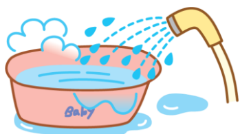
1. 汗をかいたら洗う

子どもの肌は、とてもデリケート。あせもができています。悪化するととびひになることもあります。汗をかく夏場は、さまざまなトラブルが起こりやすい時期ですので、皮膚のトラブルを悪化させないためにも毎日のケアを大切に行っていきましょう！