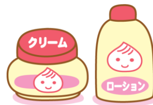
3. 洗ったあとは保湿